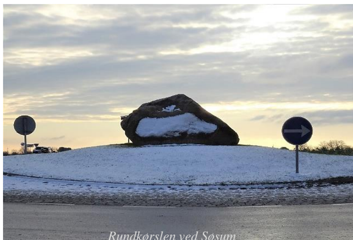
Rundkørslen ved Søsøm

Så er der kun på vegne af de 13 opstillede kandidater at ønske alle et godt valg til Seniorrådet i Egedal Kommune.